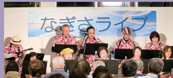
なぎさライブ（相生レレの会）