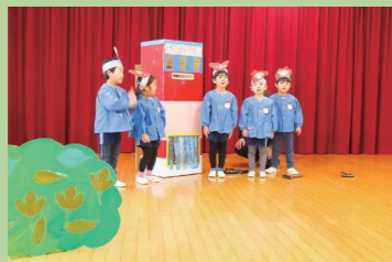
幼稚園教育（生活発表会の様子）