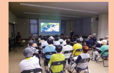
市民人権学習支援事業