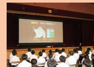
ケータイ・スマホ教室