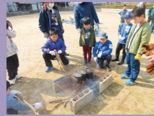
放課後子ども教室サタデースクール (焼き火ご飯作り)