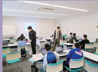
学び塾プログラミング