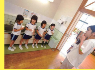
フッ化物洗口事業