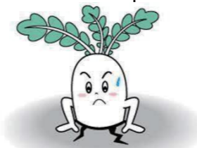
相生市ふるさと応援大使 ど根性大根の「大ちゃん」