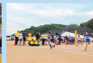
スポーツフェスティバル2025 "AIOI"