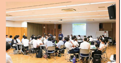
いじめ防止サミット