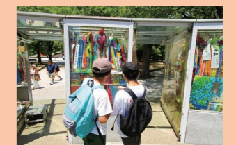
地域に学ぶ体験学習支援事業