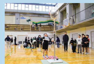
第12回相生市民アジャタ大会