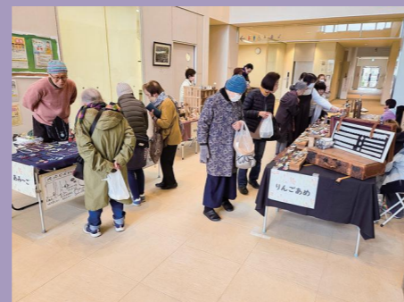
なぎさ de マルシェ