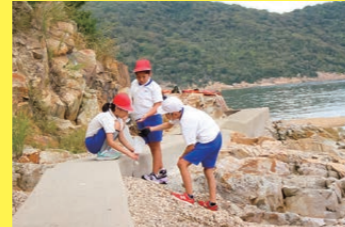
おわん島ごみ拾い