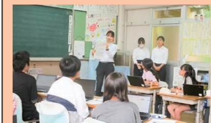
ケータイ・スマホ教室