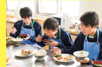
地産地消調理実習