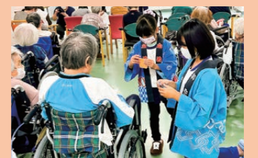
地域に学ぶ体験学習支援事業