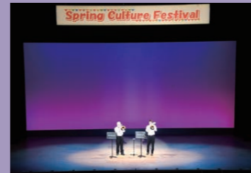
Spring Culture Festival（ステージ出演部門）