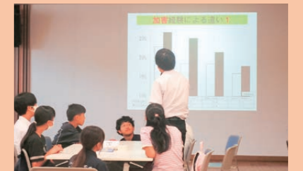
いじめ防止サミット