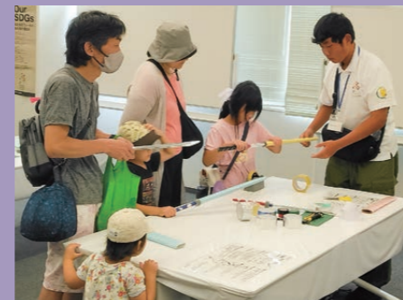
こどもフェスティバル neo