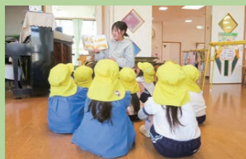
幼稚園教育（絵本の読み聞かせ）