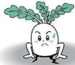
相生市ふるさと応援大使 ど根性大根の「大ちゃん」