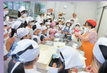
サタデースクール（パン教室）