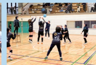
親善あそぼうる大会