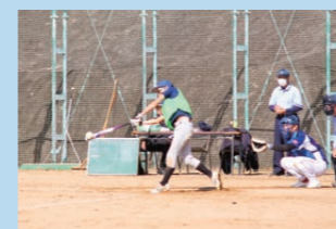
ソフトボールのつどい