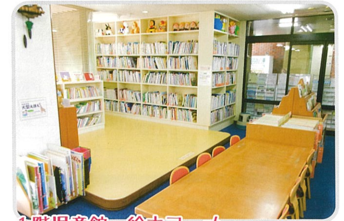
1階児童館 絵本コーナー