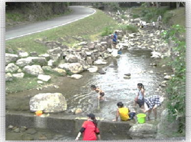
相生市観光協会ブログより

暑い夏は水遊びが一番！ 羅漢溪谷にお出かけしてみませんか。 水深が浅いので小さなお子さんでも大丈夫。 水たまりをよく見ると小魚や小さなエビがいますよ！ 石のかけにはカニも！ 捕まえられるかなー🐞🐞 魚獲り用の網や容器を持って出かけましょう。 もちろん帽子と飲み物、着替えも忘れないでね。 帰るときには捕まえた魚やカニは逃がしてあげてください。