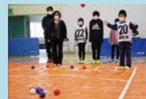
相生市民ポッチャ大会