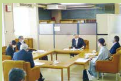
総合教育会議の開催