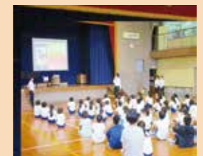
ケータイ・スマホ出前授業