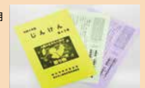
「澄んだ瞳」「じんけん」の発行