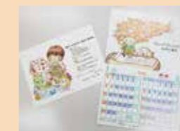
こころくんキャラクターの活用