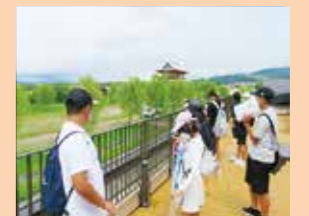
地域に学ぶ体験学習支援事業 （社会見学旅行）