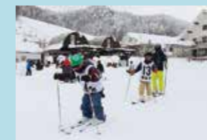
相生市民スキー・スノボ教室