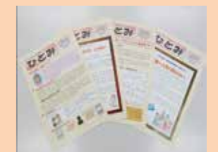
人権啓発情報紙「ひとみ」の発行