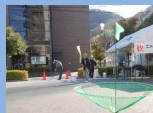
シニアフェスティバル