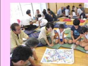
市民人権学習支援事業