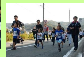
コスモスマラソン