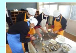
カキ料理教室(中学校)