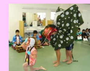
地域に学ぶ体験学習支援事業