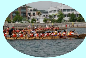
中学生ペーロン大会