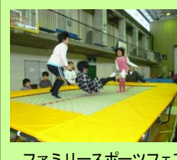
ファミリースポーツフェア