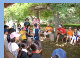
イングリッシュキャンプ