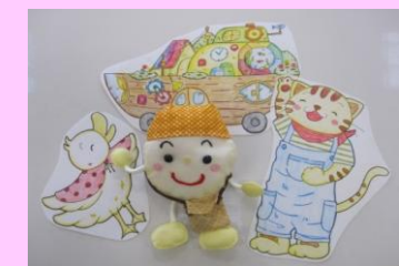
こころくんキャラクターの活用