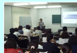
教育研究所の研修講座