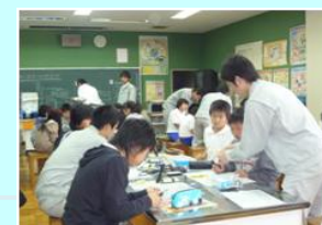
ふれあいものづくり(小学校)