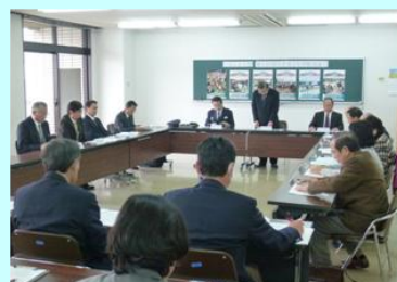
青少年問題協議会