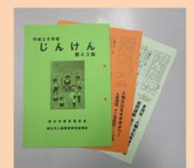
「澄んだ瞳」「じんけん」の発行