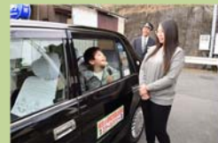
相生市通学タクシー