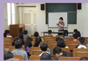
図書館子ども読書活動