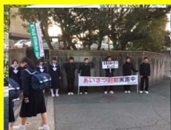
さわやかあいさつ運動