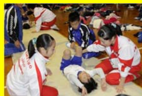
創意ある学校づくり推進事業