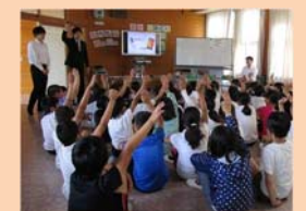
ケータイ・スマホ出前授業