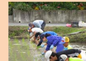
地域に学ぶ体験学習支援事業