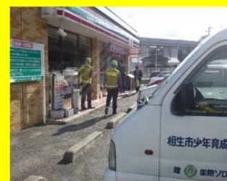
青少年を取り巻く環境実態調査（立入検