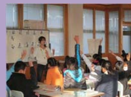
相生っ子学び塾（珠