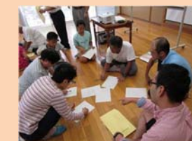
市民人権学習支援事業