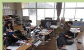
小・中学校学習環境充実事業