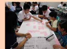
ケータイ・スマホサミット