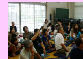
市民人権学習支援事業