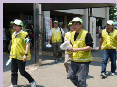
夏季特別街頭補導