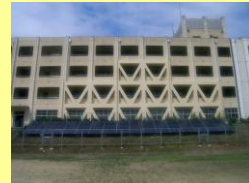
学校施設の耐震補強