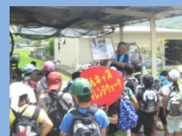
チャレンジウォーク