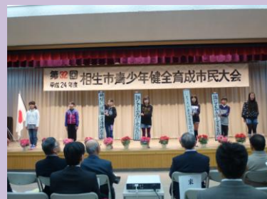
青少年健全育成市民大会