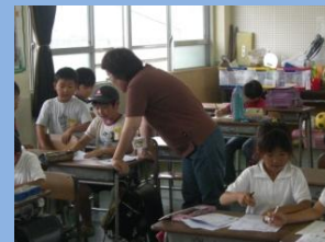
放課後子ども教室