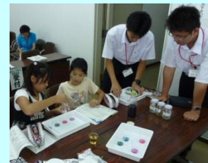
おもしろ科学実験教室