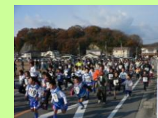
相生湾テニスコート