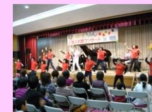
人権ふれ愛コンサート