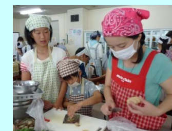
夏休み親子料理教室