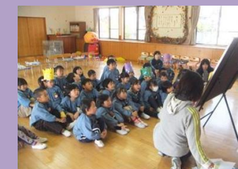
こころくん絵本の活用