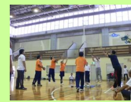
スポーツ玉入れ「アジャタ」