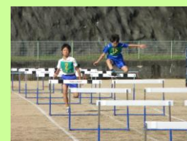
ジュニア陸上競技記録会