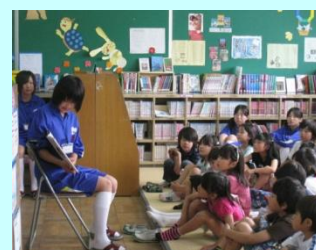
トライやる・ウィーク