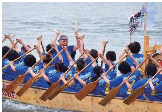
バイオレットの息の合った漕ぎ(昨年のペーロン競漕)

これまで私が漕ぎ続けてきたのは、ペーロンが好きだから。船に乗るのが大好きなんです。でも、決して強制せず、一人ひとりが主役という気持ちでいるからチームが続くのかな。