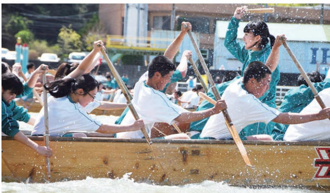
相生高校2年生による初めてのペーロン体験乗船

いきいき海上運動会 今年で25回目を迎える相産業高校の「相産ペーロンいきいき海上運動会」が6月11日に行われます。ターンの往復600mを競います。全学年がクラスチームに分かれて競漕する本格的な海上運動会です。