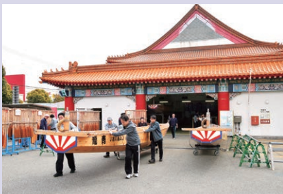
現在のペーロン艇庫(今年の舟おろし)

1997年に建設された現在のペーロン艇庫はその役目を終え、来年度から、新艇庫が文化会館とともに、新たな賑わいの拠点となります。