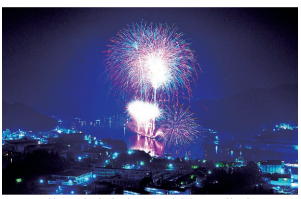
煌めく相生湾（昨年の前夜祭での花火）