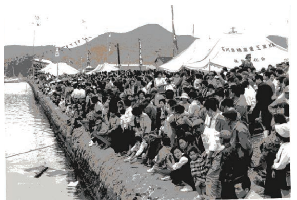
約50年前の観客の様子

さらにペーロン競漕を盛り上げていくために、一般男女だけでなく、オープンレースの決勝戦を行ったり、もっと若い世代が参加できるようにするなど、より多くの人が応援し、参加できる競漕にしていきたい。伝統の誇りあるペーロン競漕を少しでも多くの若い世代に繋いでいくことが私の使命であると考えています。