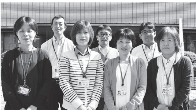
【認知症相談センター職員】