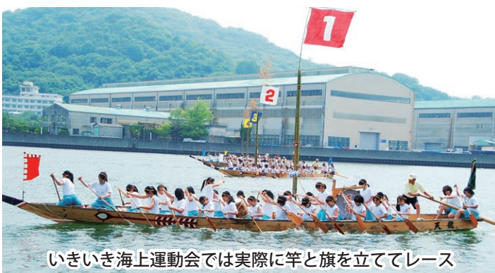
いきいき海上運動会では実際に竿と旗を立ててレース