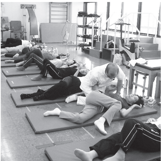
介護予防事業（膝腰らくらく教室）

答 相生市の国民健康 保険の場合はサラリ ーマンなどの定年退職後 の加入者が多く、六十五 歳以上に占める割合が高 くなっていく状況であ り、高齢者の加入率が高 いと医療費も高くなるの が一つの要因であると考