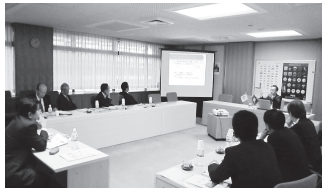
栃木県宇都宮市にて

新潟県新潟市では、平成二十五年五月に秋葉区文化会館が完成しています。座席数は、四百九十六席で、親子席や車椅子スペースも設置されており、高い音響効果を生み出すホール、リハーサルだけでなく講演会や飲食を伴うレセプションにも利用できるフロアリングの練習室、高い防音性と最新の録音機材を備えたスタジオ、会議室としても利用できる楽屋などが整備されています。