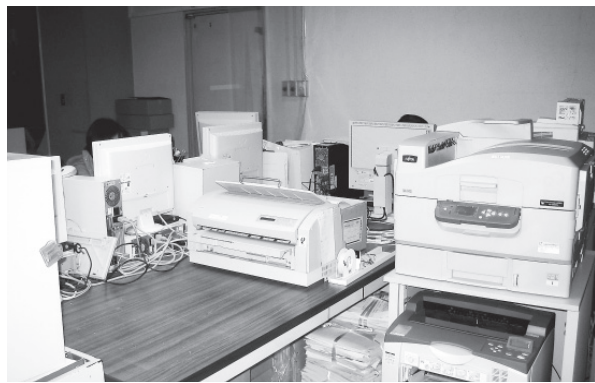
パソコン（市役所市民課）

は、平成二十年十二月一日から平成二十五年十一月三十日までのリース契約となっており、十二月からはリース契約満了により無償譲渡となっています。基幹系システム用パソコンについては平成二十年度と二十一年度に買い取りにより更新し、専用業務用パソコンについてはその時々に応じてリース契約や一括購入といった形になっています。次に入れ替え予定と今後のスケジュールについては、インターネット接続環境下にある情報系システム用パソコンと専用業務用パソコンについては、平成二十六年に予算計上して早期に更新したいと考えており、基幹系パソコンについては、平成二十九年度更新予定となっています。