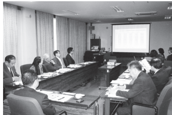
岩手県花巻市にて