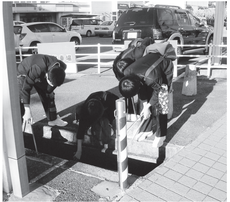
双葉中学校クリーン・クラブ