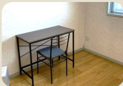
Wi-Fi完備でテレワークにもぴったり