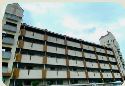
アパートタイプ・戸建てタイプから選べます