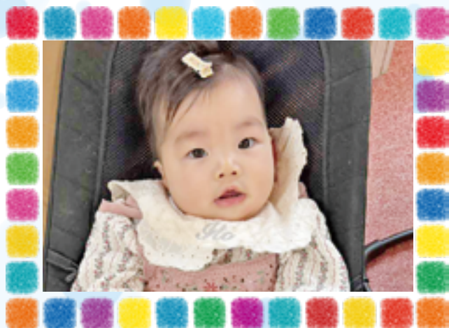
おとちゃん (R7.11.21 生)