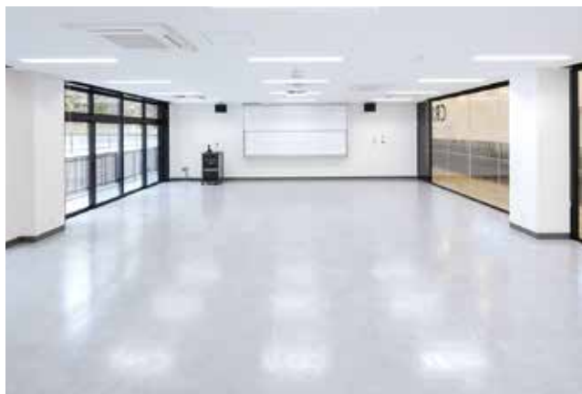
学生が理解を深める学びの空間

明るく落ち着いた雰囲気のある教室は、集中して学べる環境を整備。講義から演習まで、幅広い学びを支えます。