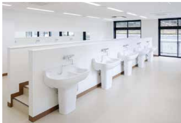
母性看護学を学ぶ実習室

新生児の沐浴を想定した設備を備えた実習室。安全で丁寧なケアや、細やかな手技や声かけの大切さを身につけます。