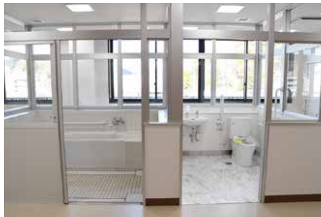
生活空間を再現した在宅看護実習室

在宅での生活を想定した設備を備えた実習室。学生は現場に近い環境できめ細かい看護技術を学びます。