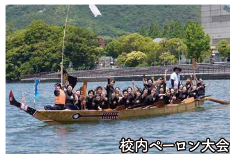
校内パーロン大会