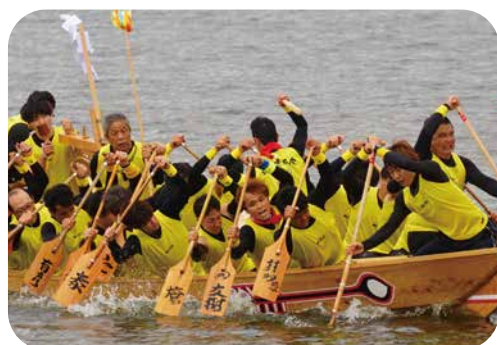
男子チーム 磯風漕友会

ペーロン部の活動で郷土文化ペーロンを通して、相生市看護専門学校と地域を連携し地域コミュニティのなかで更なる地域の人々の健康増進に働きかけ、活気あるまちづくりを目指している。