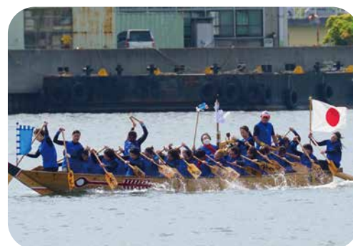
女子チーム Super Dolphin