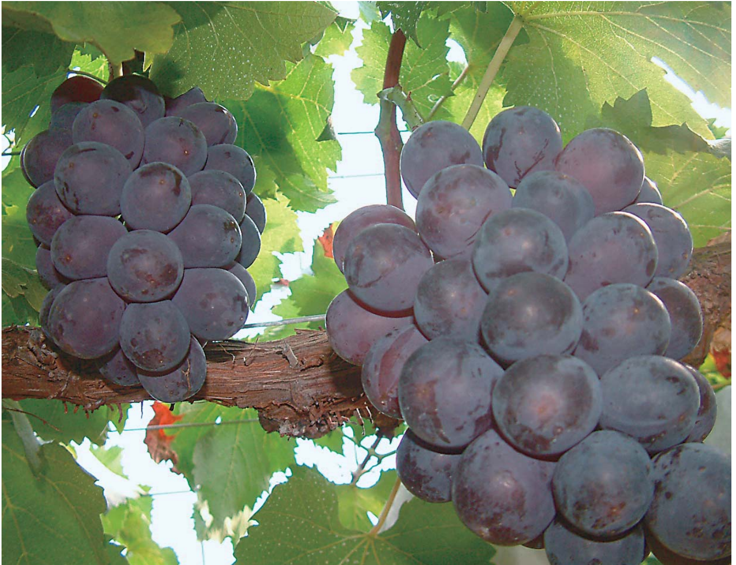
ぶどう～ピオーネ～（若狭野町入野）