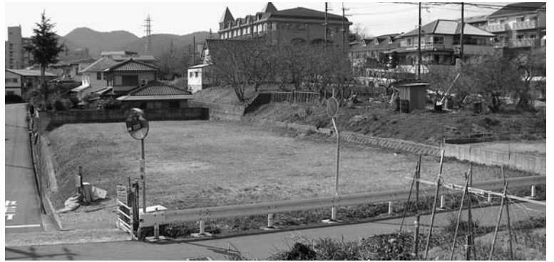
売却予定の市有地 (山手一丁目)

普通財産を売り払う場合には、相生市不動産価格審議会に諮問を行い、不動産価格の決定を行っております。近年、当審議会での答申は、売り払い時の最低価格であり、