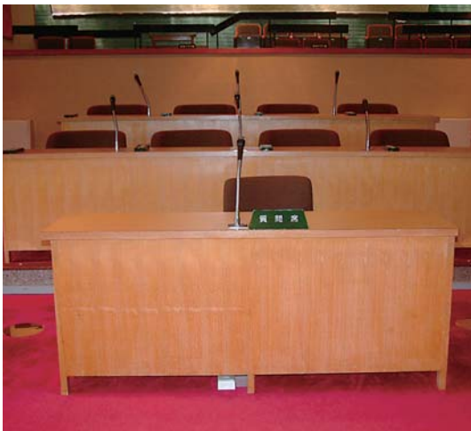
本年6月定例会より議場に質問席を設置しました。