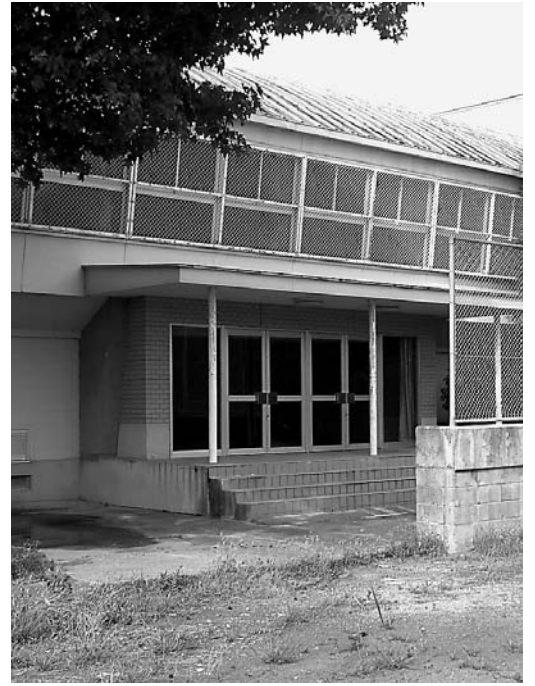
矢野川中学校体育館