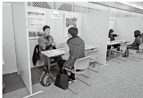
※就業相談会場では就職の斡旋は行いません。