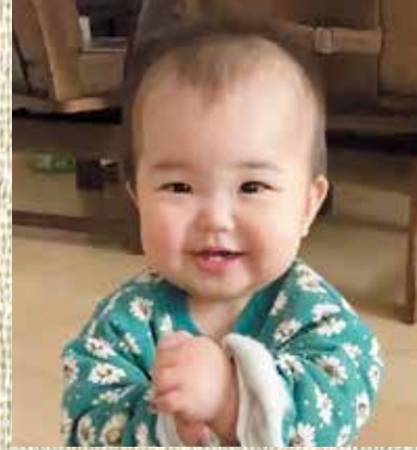
ゆずはちゃん (R5.1.30 生)