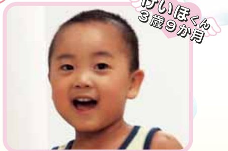
けいぼくん 3歳9か月