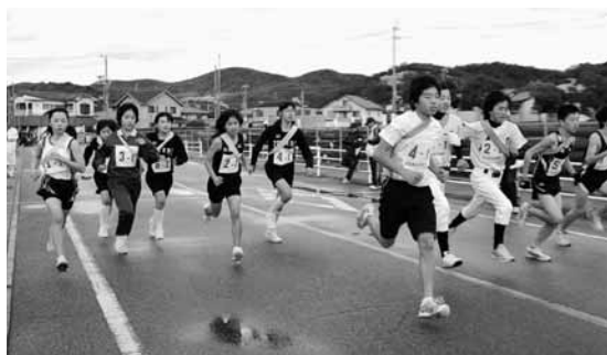
1 昨年の相生湾チビッコ駅伝の様子

区・5区3km、2～4区は2km)、3中学生男子の部(西播磨地区中学生男子で1区・5区4km、2～4区3km)、4中学生女子の部(西播磨地区中学生女子で1区・5区3km、2～4区2km)、5ファミリージュギングの部(幼稚園児から一般男女、2km) ※1～4の部門は、5区間1チーム選手5名と控え2名の計7名以内 ▼参加費 1～4 1チーム2500円(市内1500円) 5 1人2000円 ▼締切 11月27日(金)