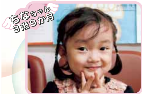
ちなちゃん 3歳9か月