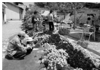
① 昨年のまちなみガーデンの様子