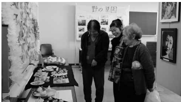
① 昨年のあいあい作品展の様子