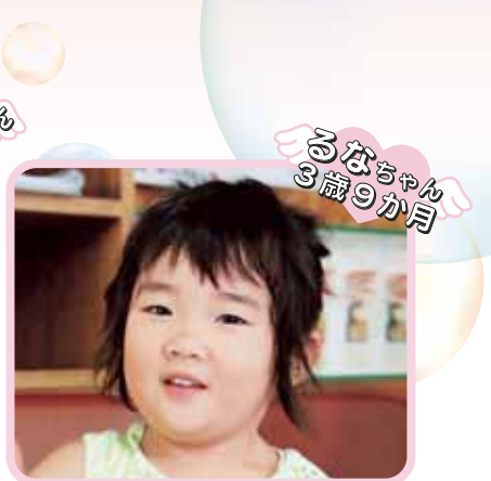
るなちゃん 3歳9か月