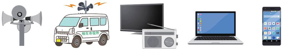
相生市防災無線 広報車 テレビ・ラジオ インターネット SNS

警戒レベル3以上が発令される場合、相生市から様々な方法で災害情報の伝達を行います。