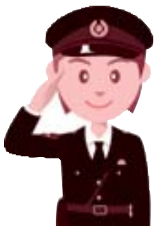
相生市人身交通事故発生件数（6月末累計）