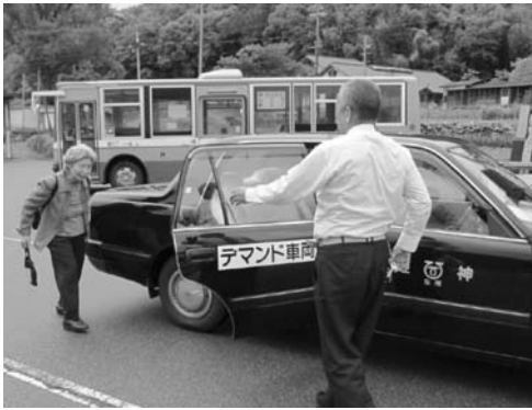
↑ 矢野地区で運行中のデマンドタクシー

また、コミュニティバスの運行には、1台につき年間約1千万円の維持管理費用が伴い、他市では、利用者の少ない路線を