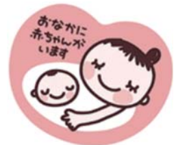
↑ マタニティマーク

た女性を見かけたら、電車やバスでは席を譲ったり、近くで喫煙しないなど、やさしい環境づくりにご協力をお願いします。