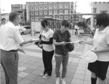
↑相生駅前でのPR活動

フレットとうちわの配布によるPR活動やJR車輛の中づり広告、姫路市・神戸市の大型ディスプレイへの掲示とJR網干駅の電照看板への掲示、ホームページの専用サイト（「子育て応援都市宣言」で検索）の立ち上げなどの広報活動を行っています。今後も引き続き、市内外に向けて積極的なPR活動を実施していきます。