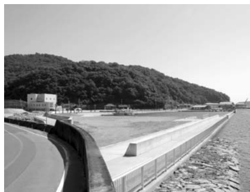
↑ 整備が進む相生港埋立地

カキの養殖漁業の拠点とするというところで、県に要望しており、平成25年度に完成する予定です。