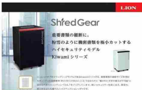
「Made in 相生」世界最小クラスの細断サイズ超ハイセキュリティシユレット...

4,026,000円 (4,026,000ポイント) 本体サイズ: W500mmD500mmH850mm重量: 約85kg 細断寸法: 約0.7mm×3.5mm