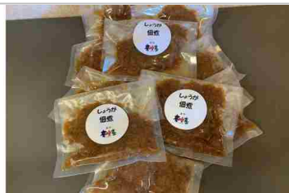
一度は食べてみたい生姜の佃煮10個セット

うまいか(290g×2) のりうまいか(82g×2) うまいか(24g×5) 雷ミックス(18枚×2) 玄米入りかりんとう(170g×1)