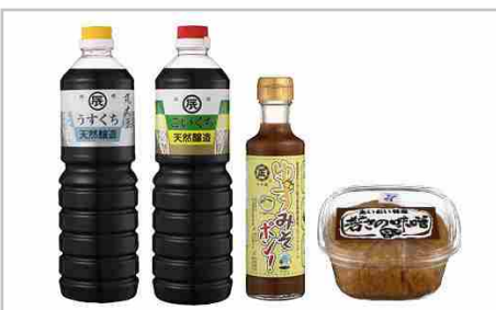
相生の絶品調味料セット