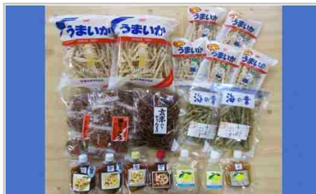
相生人気特産3種詰合せ大入りセット