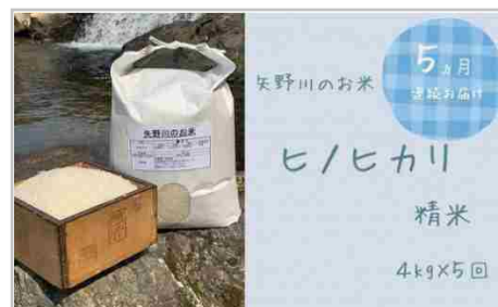
【定期便・全5回】矢野川のお米ヒノヒカリ精米4kg x 5回