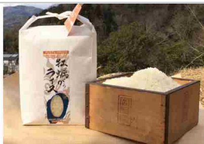
かきがらライスプレミアムコシヒカリorヒノヒカリ精米8kg