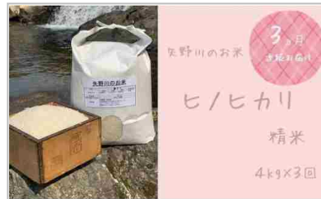
【定期便・全3回】矢野川のお米ヒノヒカリ精米4kg x 3回