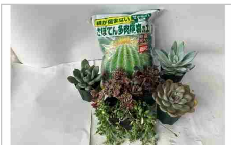
「多肉植物」5~7ポットと「根が傷まない多肉植物の土」2リットル