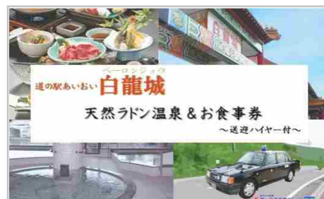
道の駅あいおい白龍城(パーロン城)天然ラドン温泉&お食事券1名さま〜…

わかさの味噌(500g) ゆずみそポン(200ml) 濃口醤油(1000ml) 薄口醤油(1000ml)