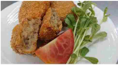
黒毛和牛ビーフコロケ10個入り