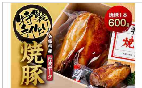
兵庫県産丹波ポークを使用した特製手造り焼豚1本