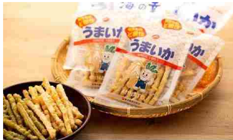
元祖スルメフライ! 「うまいか」詰合せB | おつまみすめ

6,000円 (6,000ポイント) うまいか92g×2 のりうまいか94g×1 うまいか24g×3