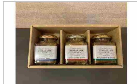
万能調味料ジンジャージャム6本セット