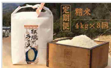
【定期便・全3回】かきがらライスプレミアムコシヒカリorヒノヒカリ精米...