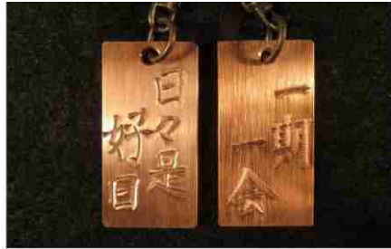
刀匠が銅板のキーホルダーに文字をお入れします。2個セット

5,000円 (5,000ポイント) 銅板キーホルダー (銅板4cm×2cm×0.2cm) ×2個