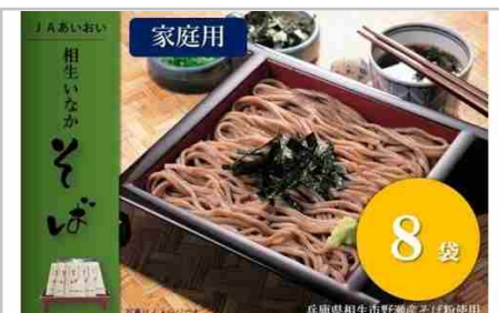
相生いなかそば(200g×8袋)

ゆずみそ2個(170g) ゆずみそ(唐辛子入り)2個(150g) ゆずみそ(しょうが入り)2個(140g) ゆずマーメイド1個(150g) ゆずゼリー1個(150g)