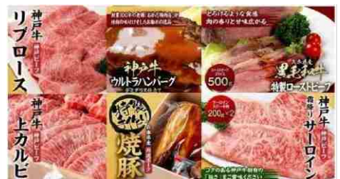
月に一度はお肉の日! 老舗精肉店主おすすめ定期便【6ヶ月】

2,000,000円 (2,000,000ポイント) 短刀1口 ・刃長8寸〜8寸5分 (24〜26cm) ・平造り ・受注後製作いたします。 ・彫物は入っておりません。