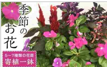
相生から季節のお花の寄植