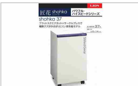
「Madein相生」パワフル・ハイスピード細断の高性能シュレッター「シュ...

本体サイズ：W500mmD500mmH850mm重量：約96kg 細断寸法：約3mmx14mm