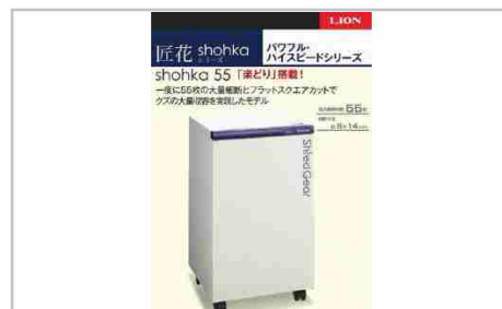
「Madein相生」パワフル・ハイスピード細断の高性能シュレッター「シュ...

本体サイズ：W500mmD500mmH850mm重量：約96kg 細断寸法：約6mmx14mm