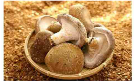
訳あり中身美人の新鮮しいたけ750g【アウトレット】

5,000円 (5,000ポイント) 銅板キーホルダー (銅板4cm×2cm×0.2cm) ×2個