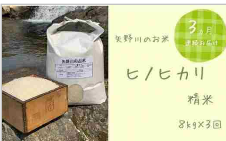
【定期便・全3回】矢野川のお米ヒノヒカリ精米8kg x 3回