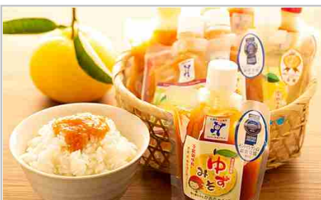
相生発！うまいもん直行便5種セットB

ゆずみそ1個(170g) ゆずみそ(唐辛子入り)1個(150g) ゆずみそ(しょうが入り)1個(140g) ゆずマーメイド1個(150g) ゆずゼリー1個(150g)