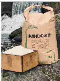
矢野川のお米ヒノヒカリ精米8kg