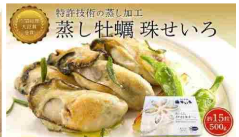
内閣総理大臣賞受賞蒸しカキ珠せいろ大粒規格500g

6,000円 (6,000ポイント) うまいか92g×2 のりうまいか94g×1 うまいか24g×3