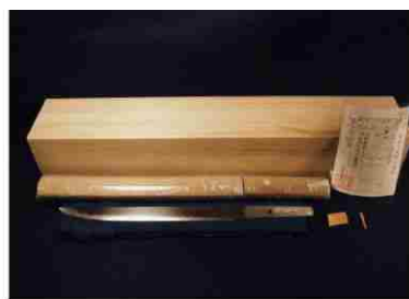
刀匠桔梗隼光作 (短刀)

4,026,000円 (4,026,000ポイント) 本体サイズ: W500mmD500mmH850mm重量: 約85kg 細断寸法: 約0.7mm×3.5mm