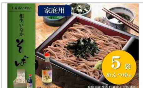
相生いなかそばめんつゆセット