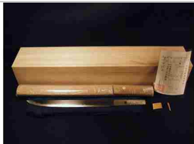
刀匠桔梗隼光作（短刀）