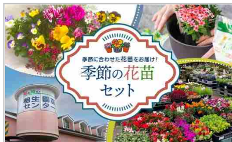
季節の花苗セット