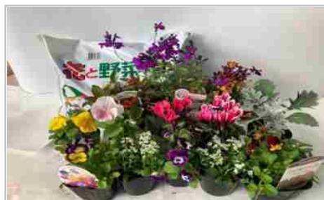
「季節の花苗セット」と「花の培養土」 約9リットル