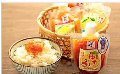
相生発！うまいもん直行便5種セットA

【ジャムベース180g】 高知県土佐市の「土佐一」、甜菜糖でじっくりと「身体の芯から温める」成分を抽出し、最後にレモンを加え添加物なしの身体に優しいジャムです。