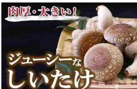
【肉厚で、大きく、ジューシー】瀬戸内しいたけ400g