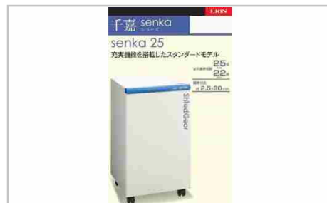
「Madein相生」スタンダードモデルシュレッター「シュレッドギア千嘉」