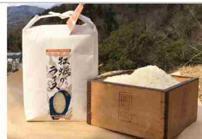
かきがらライスプレミアムコシヒカリorヒノヒカリ精米4kg