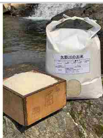
矢野川のお米ヒノヒカリ精米4kg