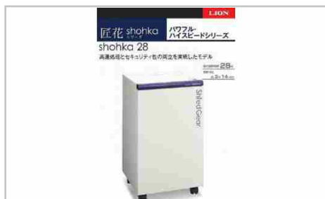
「Madein相生」ハイスピード・ハイセキュリティ細断の高性能シュレッター

本体サイズ：W500mmD500mmH850mm重量：約83kg 細断寸法：2.5mmx30mm