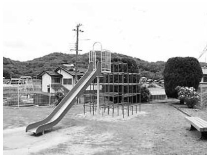
緑ヶ丘西第一公園