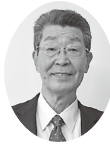
副議長 森下 高明 氏