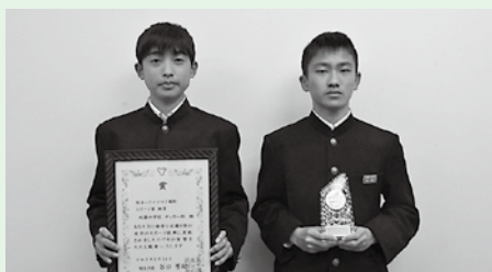
双葉中学校サッカー部