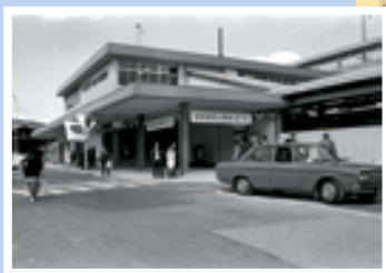
昭和47年新幹線開通に合わせて相生駅の駅舎もリニューアル。

昭和47（1972）年3月15日、当時の国鉄山陽新幹線が開通し、相生駅にも新幹線が発着するようになりました。現在に至るまで、西播磨地域の玄関口としてたくさんの方々を迎えてきた相生駅。これからも新幹線と在来線を利用し、相生の交通利便性を守っていきましょう。