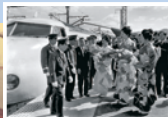
新幹線ホームでの開通記念式典。当時のみなとの女王が花束を贈呈。