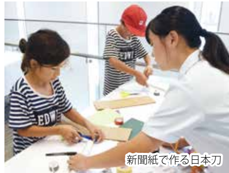
新聞紙で作る日本刀

夏の楽しいひとときを演出する「こどもフェスティバルneo」が扶桑電通なぎさホールで開催されました。オリジナリティ溢れるハンドメイドのおしゃれなお店が集いました。新聞紙で作る日本刀などの体験コーナーでは子どもたちが一生懸命手作りし、お父さんお母さんと一緒に夏休みの思い出を作っていました。