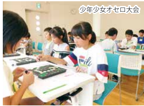
少年少女オセロ大会