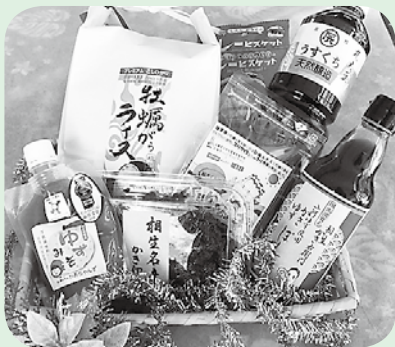
特産品セットの一例

健診や健康づくり事業への参加などで「あいおい健幸マイレージ」を180ポイント以上貯めると、応募者全員に「相生市ごみ袋(中)10枚入り」と「ペーロン温泉割引券10枚」をプレゼント。さらに抽選で豪華特産品が当たるので、期間中に楽しくポイントをためて健康になりましょう。