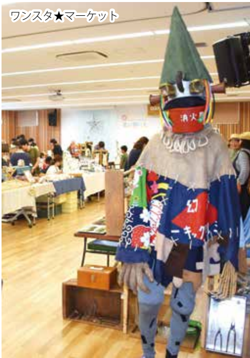
ワンスタ★マーケット