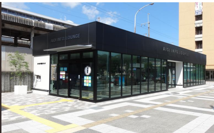
あいおい情報ラウンジ 外観