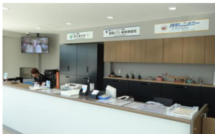
観光案内所・交通事業者窓口