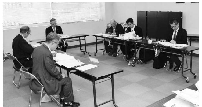
空家等対策計画を確認する「空家等対策協議会」