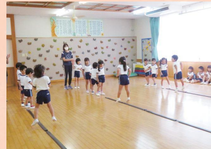
後ろ向きでも上手にジャンプできるよ