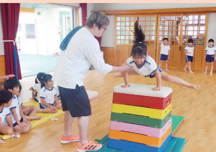
6段のとび箱が飛べたよ