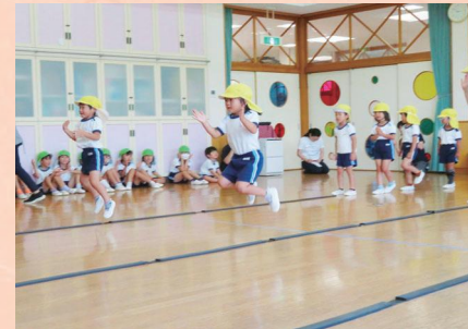
音楽に合わせて、いろいろなジャンプに挑戦するよ