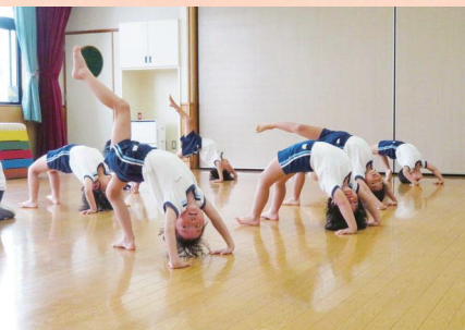
足上げブリッジはバランスを取るのが難しいな