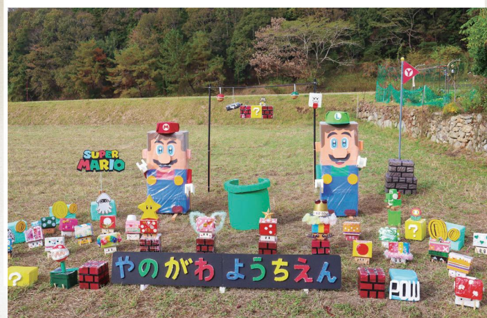
2023年羅漢の里もみじまつりのかがしコンテストで相生市立矢野川幼稚園が優秀賞を受賞しました。