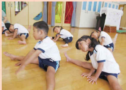
ケガ防止につながるからストレッチも大事だよ