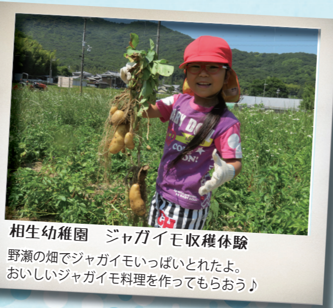
相生幼稚園 ジャガイモ収穫体験 野瀬の畑でジャガイモいっぱいおとれたよ。 おいしいジャガイモ料理を作ってもらおう！