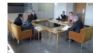
相生市総合教育会議