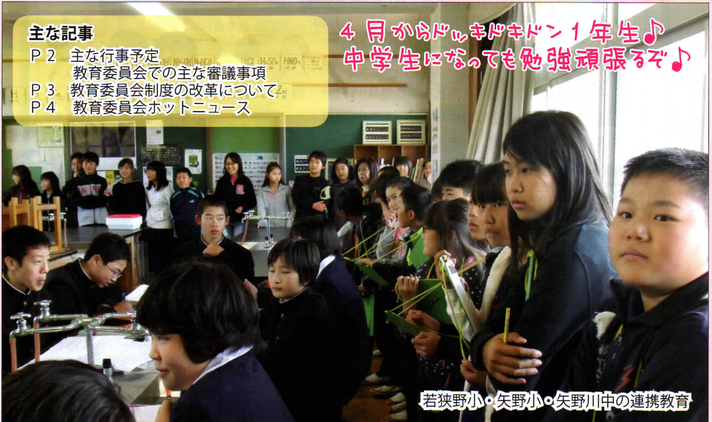
若狭野小・矢野小・矢野川中の連携教育