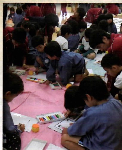
山手幼稚園児と相生高校生合同で 相生マップ作成♪ 相生市っておおきいなあ〜♪