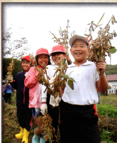
矢野小・中央小交流授業で大豆の収穫♪ こんなに大きく育ったよ♪