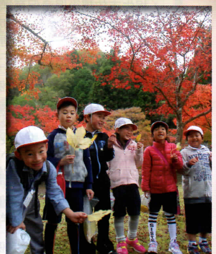
若狭野小・矢野小合同授業で羅漢の 紅葉狩り♪ とっても綺麗だったよ♪