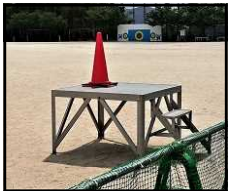
外遊び中止の カラーコーン

校内放送で もりもりタイム(昼休み)の外遊び中止を連絡し、帰宅時はマスクを外し、なるべく話をしないで下校するよう呼びかけました。