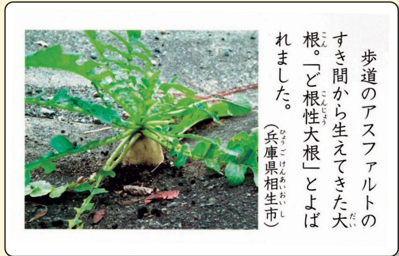
「わたしたちの道徳」(小学校 3・4 年生用)(文部科学省) から一部抜粋