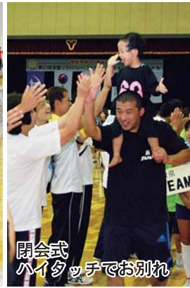
閉会式ハイタッチでお別れ