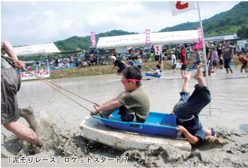
「泥そりレース」ロケットスタート!?