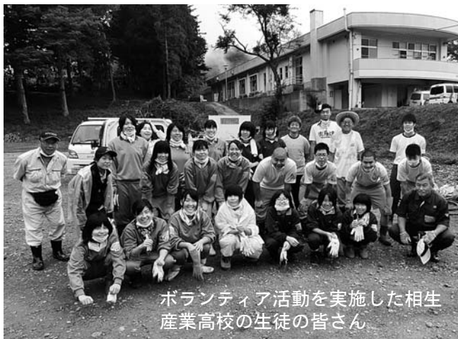
ボランティア活動を実施した相生産業高校の生徒の皆さん

みんなが疲れてきた時に、お墓の掃除に来られたおばあちゃんにトマトをたくさんいただきました。ふつうのトマトだけれど、特別においしかったです。そして、何度もありがとうと言ってくれて、少しでも役に立てたのかなと思えてうれしかったです。