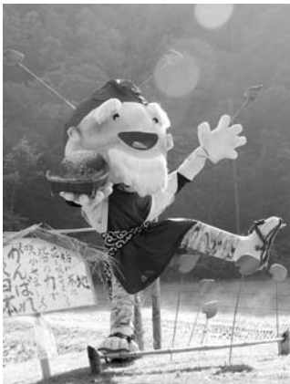
昨年度個人の部かがし大賞作品

■各賞 個人の部、団体の部（保育所・幼稚園、事業所、小学校・中学校、PTA、グループなど）に分け、次の賞を表彰します。