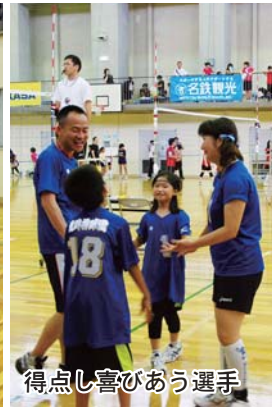
得点し喜びあう選手