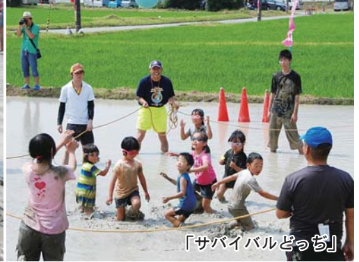
「サバイバルどっち」