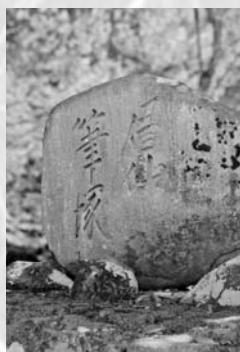
羅漢の里 眉仙筆塚

明治31年(1898年)、岡倉天心は日本美術学校長を辞職し、橋本雅邦とともに日本美術院を創設します。天心たちの創設した日本美術