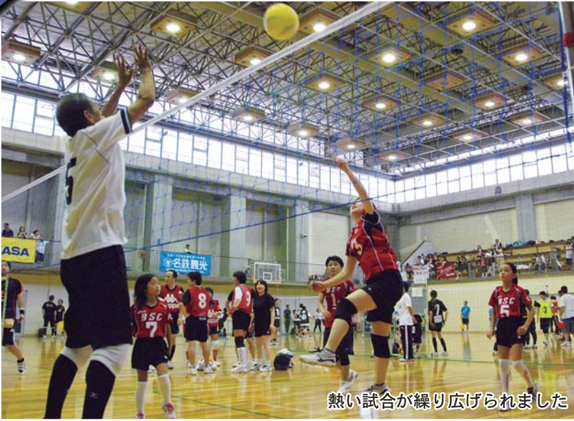
熱い試合が繰り広げられました