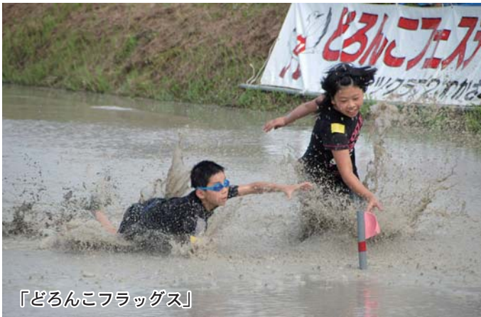
「どろんこフラッグス」