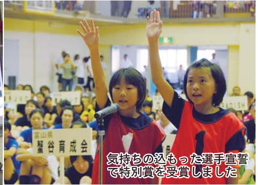
気持ちの込めった選手宣誓で特別賞を受賞しました