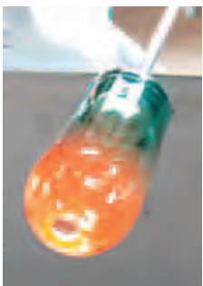
くびれ部分を切り離し、ポント竿に持ち替えて、再び温める。