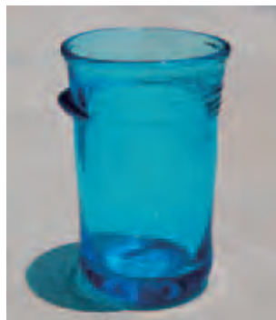
吹きガラスの体験では、上記のようなグラスを製作します。

これは、リサイクルの現場に触れ、廃ガラスから作品を作り上げる工程を体験することで、再生の喜びと環境への意識を深めることを目的としています。