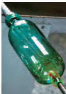
ガラスの底面の中央にもう一本別の竿(ポント)をつける。