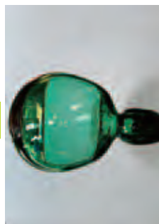
器の大きさになるまで息を吹き込む。吹き竿から外すためにくびれをつける。