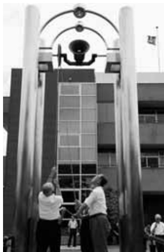
① 昨年の8月9日の様子