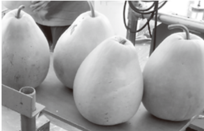
かんぴょうの元となる夕顔の実

相生市の農業の活性化を図るため、大規模農家や集落営農組織などの担い手育成が急務であるとともに、加工、販売などの6次産業化の取り組みを拡大させ、付加価値や収益性の高い農業への転換を図っていきます。 夕顔、メロン、ゆずについては地域の特産物として作付けを拡大し、ブランド化への取り組みを進めます。