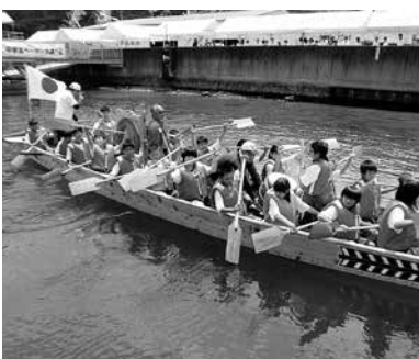
中学生ペーロン大会

我が国や郷土が育んできた日本の伝統や文化を学び、古典などが国の言語文化、文化財や年中行事の理解、伝統音楽・和楽器・武道、和食や和服の指導の充実を図っていきます。