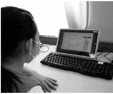
情報機器を活用した学習

相生市では、令和二年度中に児童生徒一人一台タブレット端末や、ネットワーク環境の整備を完了し、情報化教育・プログラミング教育の充実に取り組んでいきます。