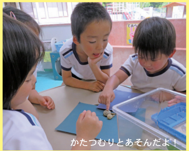
かたつむりとあそんだよ！