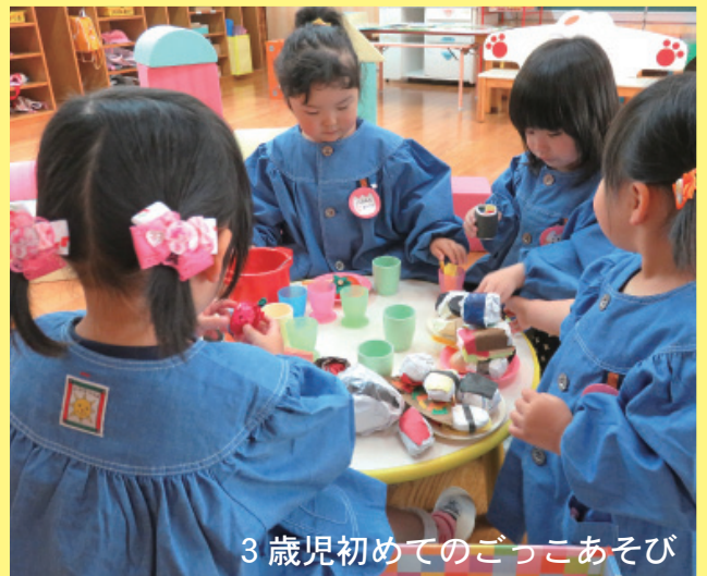
3歳児初めてののごっこあそび