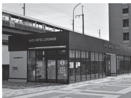
駅前情報発信施設

答 新たに設置を予定している観光案内図は、新幹線駅として、広域観光の拠点となるよう期待されている特殊性を加味し、市内だけでなく、西播磨地域を表示する広域の案内図としています。