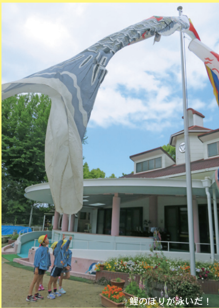
鯉のぼりが泳いだ！