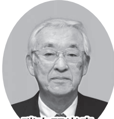
瑞宝双光章 (学校保健功労)