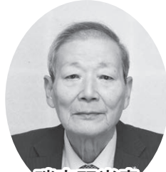
瑞宝双光章 (更生保護功労)