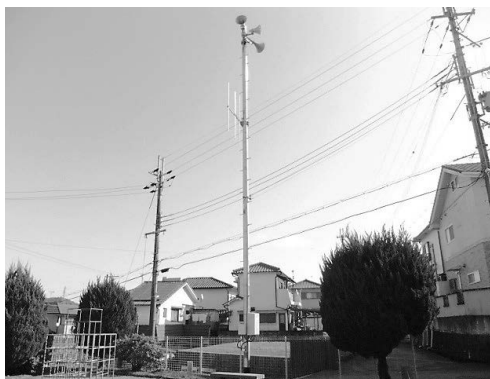
防災行政無線（写真は緑ヶ丘西第一公園）