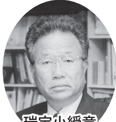
瑞宝小綬章 (教育功労)